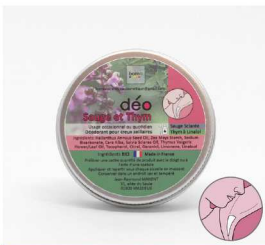
DEO Sauge et Thym