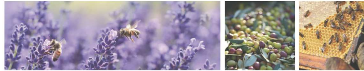
Extrait de Lavande