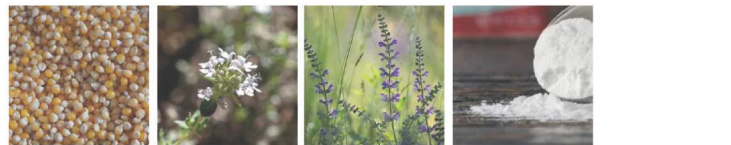
Amidon de Maïs