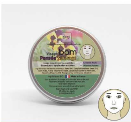
BOM Pensée Sauvage