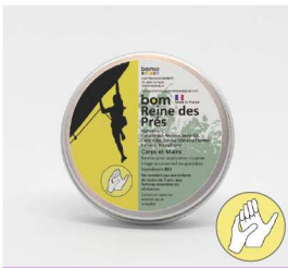
BOM Reine des Prés